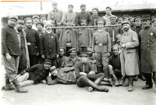
Abbildung 3: Franse en Russische krijgsgevangenen in Speyer

Veldpostbrieven van de soldaten boden een inzicht in de gebeurtenissen aan de frontlijn. Het infanterieregiment 68 vanuit Koblenz en Ehrenbreitstein en het infanterieregiment 17 vanuit Germersheim Worms als ook de Paltse divisie waren betrokken bij de Slag aan de Somme; brieven van de frontsoldaten informeerden over het dagelijks leven tijdens de oorlog. De Rijnland-Paltse bevolking zagen de verschrikkingen van de oorlog, omdat de meesten van de oorlogsslachtoffers en de gewonden werden vervoerd door deze regio. Er waren lazareten in in vele steden en gemeenten.