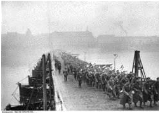
Abbildung 1: Troepenvervoer over de rijnbrug in Koblenz

Het huidige Rijnland-Palts was geen direct oorlogsgebied, maar toch een grensstreek en om die reden betrokken bij de gebeurtenissen van 1914 tot 1918. Het dualisme van oorlogsenthoustiasme en afwijzing was duidelijk: aan de ene kant wilden de mensen zich verdedigen tegen de ‘erfvijand’ Frankrijk, aan de andere kant waren zij bang voor het oorlog. In de buurt van het westfront kon de bevolking zich niet onttrekken aan de oorlog en zijn gevolgen. De eerste waarneembare verandering was de aanwezigheid van de militairen. In velen steden waren er legerkampen, bijvoorbeeld kamperden over 40.000 soldaten in Koblenz en over 25.000 in Germersheim. In deze steden als ook in Landau und Mainz worden de verdedigingswerken weliswaar versterkt, hoewel zij tegen de nieuwe gevechtswapen niet meer kunnen standhouden. Veel belangrijker was de organisatorische functie: de vestingen deden dienst als accommodaties en strategische centralen. Tijdens de eerste oorlogsmaanden waren de militaire complexen meest te klein, daarom werden ook openbare gebouwen gebruikt. Bovendien, een deel van de bevolking moest zijn eigen woonruimte ter beschikking stellen. Keizer Willem II bleef in het begin van de oorlog in Koblenz – in deze stad was er in augustus 1914 de Algemene Hoofdkwartier. Von januari 1917 tot maart 1918 bevond zich de hoofdkwartier van de OHL in Kreuznach.