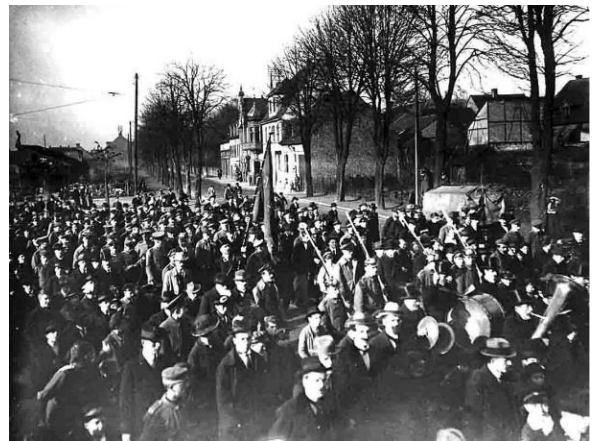
Abbildung 4: Demonstranten met Arbeiter- und Soldatenräten in Kaiserslautern

De verzorging van de bevolking werd steeds moeilijker; de mensen leden honger en waren oorlogsmoe. In november 1918 de Arbeiter- und Soldatenräte werden opgericht. In het bos van Compiègne werd op 11 november 1918 de wapenstilstand gesloten. Dus de Eerste Wereldoorlog was afgelopen en de bezetting begon. Van Einde 1918 tot 1930 behoorden grote delen van het Rijnland en de Palts aanvankelijk tot dem amerikanischen, dan tot de Franse bezettingszone. Die in het Verdrag van Versailles vastgelegde bepalingen, vooral de Oorlogsschuldartikel 231, werden waargenomen door een meerderheid van de bevolking als een opgelegde vernedering. Tegen deze achtergrond vond de nationaalsocialistische herzieningsbeleid vooral in de van Frankrijk bezette gebieden een brede, noodlottige instemming.